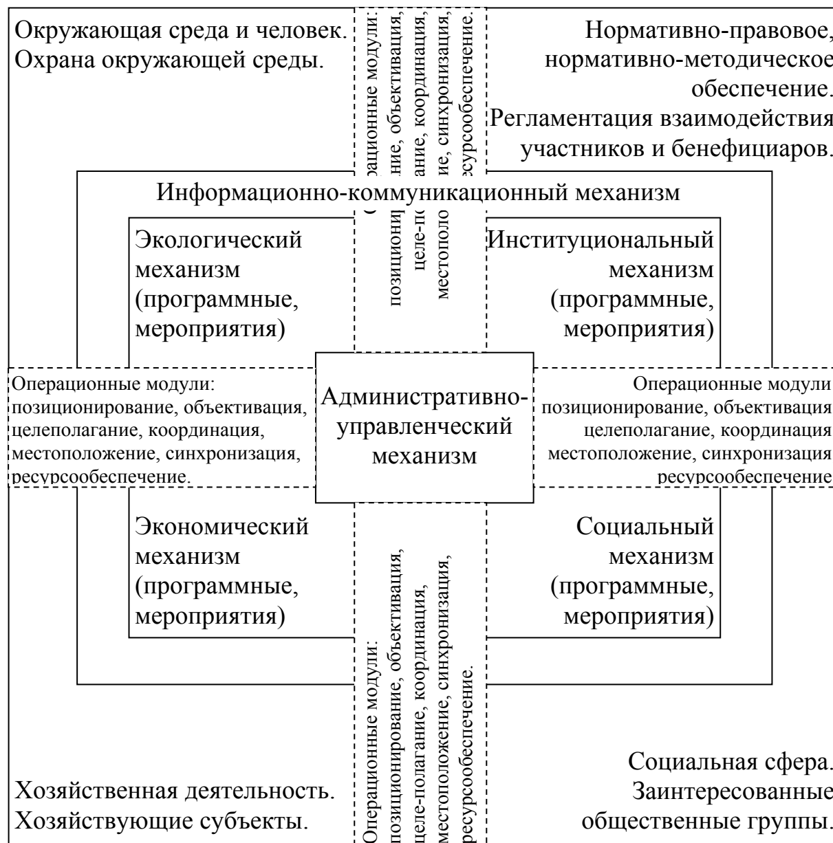
Рис. 3. Модель механизма реализации комплексной программы развития сельского муниципального образования

Разработанный автором механизм реализации комплексной программы развития сельского муниципального образования представлен на рис. 3.