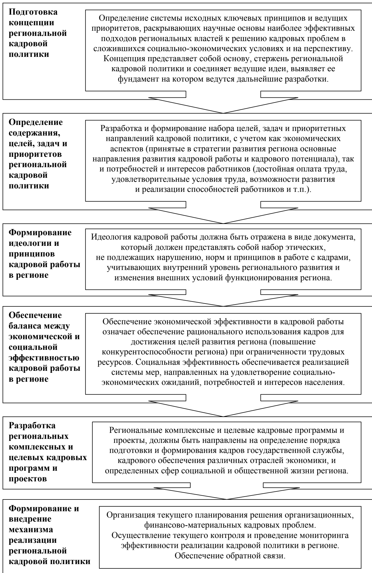
Рис.2. Методика организации региональной кадровой политики